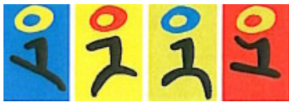
Table des mati res